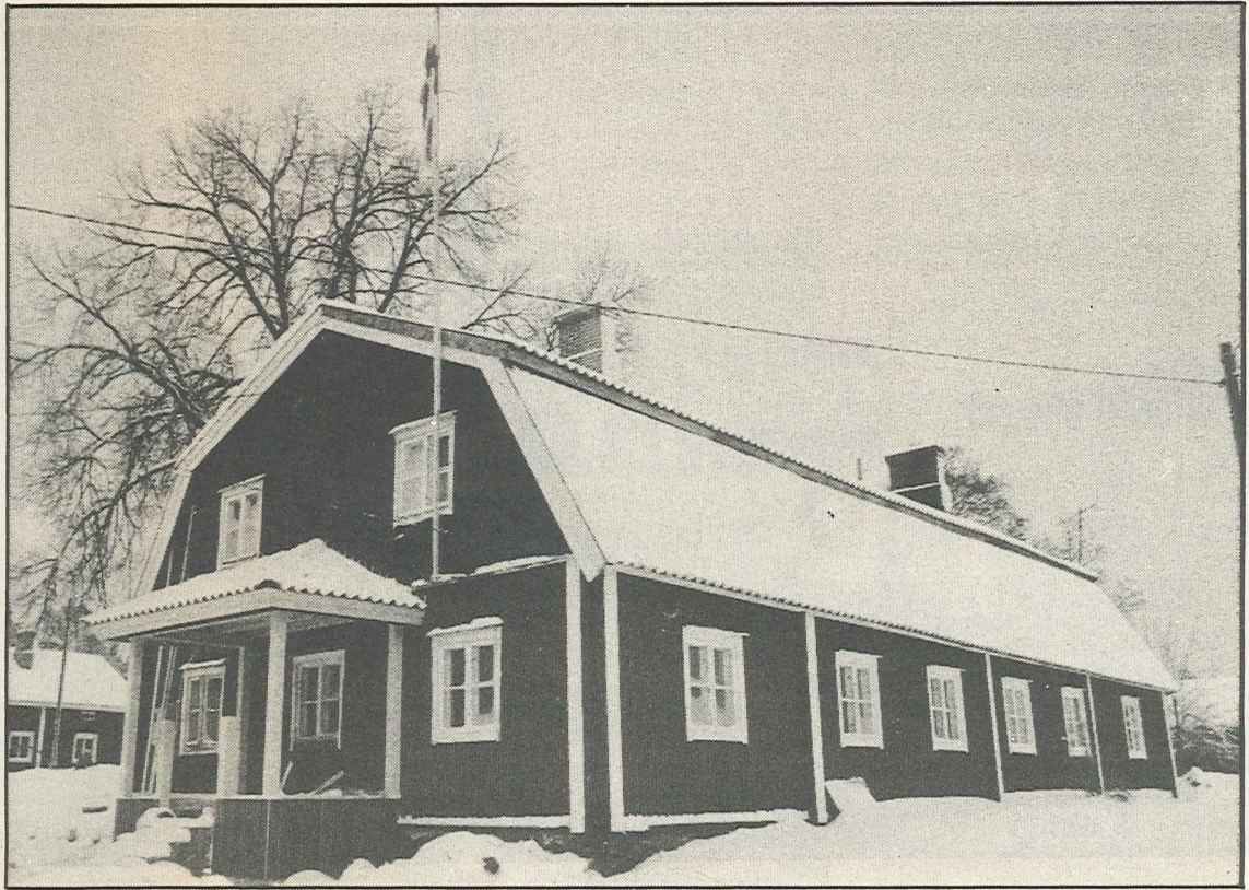
Ett av de gamla bostadshusen i Strömfors bruk. Huset är historiskt riktigt restaurerat och numera bebott.