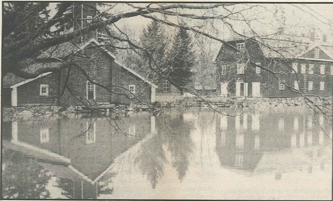
Strömfors bruk, en unik bruksmiljö, en idyllhet — pietetsfullt restaurerat.

På vägen till Rökfors bro utpekades en gammal marknadsplats i Abborfors dit man på 1740-talet ville placera den blivande staden i Lovisa. Men jordmänen var gynnsammare i dåvarande Degerby, och så gick det som det gick.